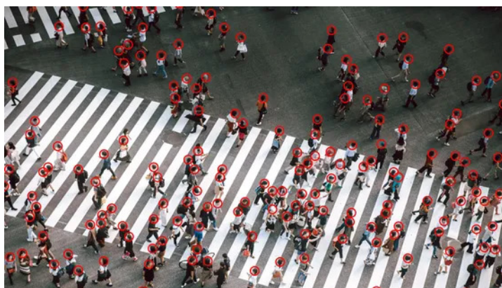
La surveillance de masse

La protection des données des personnes est aussi un enjeu pour le Maroc dont les citoyens peuvent faire l'objet d'une telle surveillance à leur insu, où qu'ils se trouvent dans le monde, via la collecte des données de leur téléphone mobile ou de leur usage d'Internet. Une politique affirmée de protection des droits individuels pourrait donc s'avérer utile.